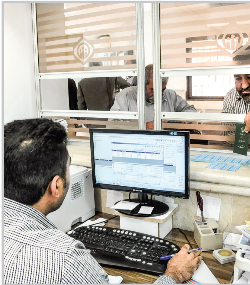
در تمامی مواردی که حق بیمه مسترد می‌شود، سوابق مربوط به دوره‌ای که حق بیمه آن پس داده شده نیز حذف می‌شود.

در صورت پرداخت هم‌زمان حق بیمه اجباری یا بیمه‌های