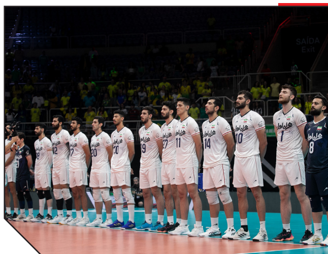
ناکامی والیبالیست ها در نبرد انتخابی المپیک

تیم ملی فوتبال مردان ایران که از هدایت امیر قلعه نویی بهره مند بود، از ۲۴ دی ماه سال ۱۴۰۲ رقابت های خود را در مسابقات جام ملت های آسیا آغاز کرد تا شاید بتواند بعد از سال ها این بار با جام به کشور بازگردد. شاگردان قلعه نویی در مرحله گروهی این مسابقات که از ۲۴ دی ماه تا سوم بهمن ماه ادامه پیدا کرد موفق شدند مقابل تیم های امارات، هنگ کنگ و فلسطین به برتری رسیده و به عنوان تیم نخست راهی مرحله دوم شوند. جایی که باید به مصاف تیم سوریه می رفتند. ملی پوشان کشورمان در دیدار مقابل سوریه در ضربات پنالتی به پیروزی دست پیدا کردند و حریف تیم ژاپن در مرحله یک چهارم نهایی شدند. ژاپنی که مقابل ایران شکست خورد و تیم ملی فوتبال کشورمان را راهی نیمه نهایی کرد. در حالی که شاگردان قلعه نویی با عبور از سد قطر می توانستند راهی فینال جام ملت های آسیا شوند، در این رقابت با نتیجه ۳ بر ۲ تن به شکست دادند و از رسیدن به فینال و جام قهرمانی بازماندند تا حسرت کسب رتبه نخست مسابقات جام ملت های آسیا همچنان برای فوتبال ایران باقی بماند. در این دوره از مسابقات تیم قطر که از امتیاز میزبانی بهره مند بود در فینال با عبور از سد اردن توانست جام قهرمانی را برای دومین دوره پیاپی بالای سر ببرد.