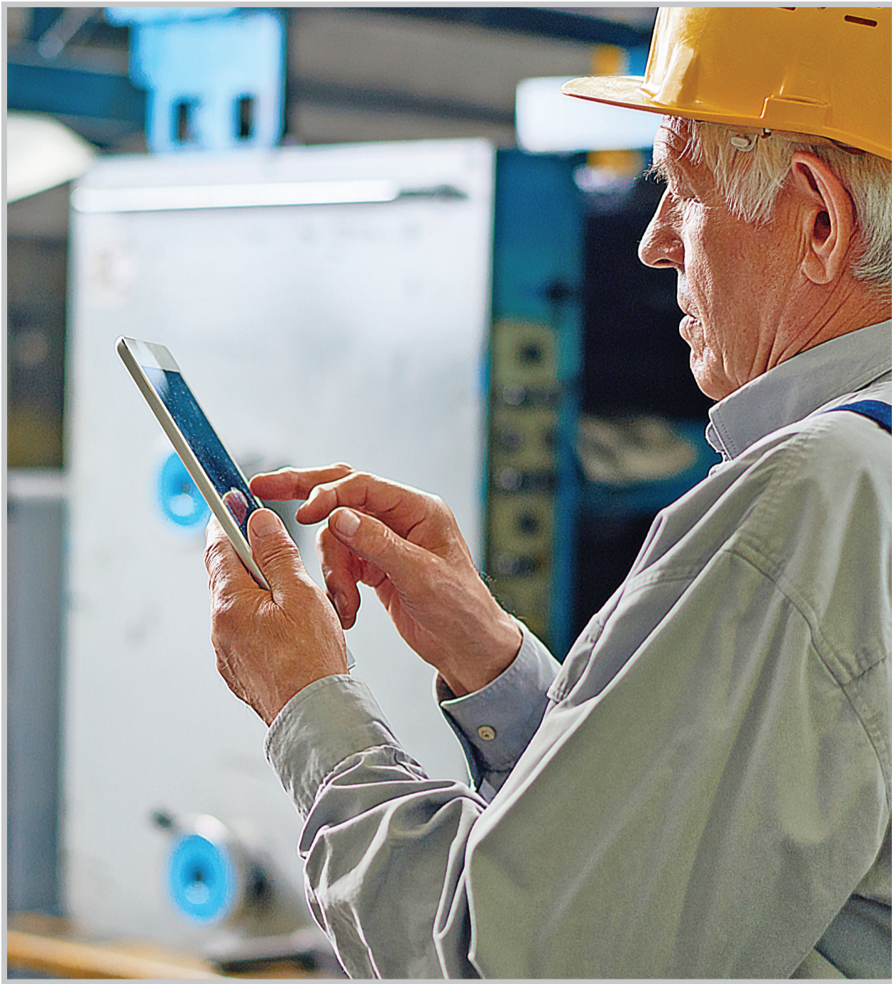
مدیر انستیتوی پژوهش جمعیت آلمان، می‌گوید که در این کشور، گروه جدیدی در حال شکل‌گیری است که بین ۶۰ تا ۸۰ سال دارند و بسیار فعال و حاضر در عرصه‌های مختلف زندگی هستند.

با نگاهی به جامعه آلمان، به نظر می‌رسد که آلمانی‌ها از هدف یادشده، چندان دور نباشند. در این کشور، پدر بزرگ‌ها و مادر بزرگ‌ها به فرزندانشان نوه‌هایشان کمک مالی می‌کنند؛ وظیفه نگهداری از نوه‌هایشان را برعهده می‌گیرند، غذا می‌پزند و خرید می‌کنند. اما به نظر وزیر کشور آلمان، هنوز جادارده که دامنه فعالیت اجتماعی سالمندان، گسترده‌تر شود. آیا این بدین معناست که در آینده، چیزی به نام بازنشستگی در آلمان وجود نخواهد داشت؟ و هرکس تا آخر عمر، تکالیفی دارد که باید انجام دهد؟ پیش‌بینی می‌شود که چنین وضعیتی پیش بیاید، چون در آینده شمار سالمندانی که نتوانند بدون کارکردن از پس هزینه زندگی خود برآیند، کاهش خواهد یافت.