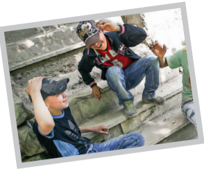
یکشنبه ۱۵ بهمن ۱۳۹۶ • شماره صد و چهل

بیشترین تعداد کودکان و نوجوانان بدون شناسنامه در خانواده‌های حاشیه‌نشین شهرهای بزرگ که از فقر اقتصادی رنج می‌برند زندگی می‌کنند. کودکانی که از والدینی متولد می‌شوند که کم‌ترین استطاعت مالی را برای بزرگ کردن یک کودک دارند به‌گونه‌ای که این فقر، خود را در ثبت هویت شهروندی فرزندان‌شان هم به‌رخ می‌کشد. کودکان بدون شناسنامه از بسیاری از حداقل‌های رفاه از جمله حمایت‌های اجتماعی، اقتصادی، تحصیلی و درمانی محروم می‌مانند و در آینده در همان چرخه فقری که زندگی‌شان را از آن شروع کرده‌اند باقی می‌مانند. چرخه‌ای که اگر سیاستگذاران رفاهی برای قطع کردن آن چاره‌ای نیندیشند، برای فرزندان آن‌ها هم ادامه خواهد داشت.