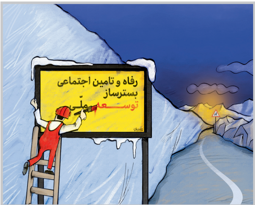
اکثر برنامه‌های ضد فقر اجرا شده در ایران، مبتنی بر رویکردهای بولی بوده و غالباً نیز به دلیل تعارض گفتمانی اجرایی به موفقیت نرسیده‌اند / طرح: هادی حیدری

آتیه‌نو، سه برنامه فقرزدها و راهبردهای دولت دوازدهم برای ریشه‌کنی فقر را بررسی می‌کند