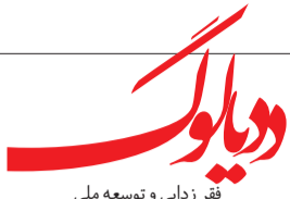
فقر زدایی و توسعه ملی

بر اساس پیش‌بینی‌ها، پروژه رفه فقر مطلق و حمایت فراگیر از اقشار کم‌درآمد، سال آینده کلید می‌خورد؛ بدین ترتیب که دولت، ابتدا برای خانوارهای فقیر – با توجه به تعداد اعضای فقیر آنها – کف درآمدی تعیین می‌کند. این کف درآمدی، نسبتی با مقرری‌های پرداختی نهادهای حمایتی دارد. پس از آن، خانوارهایی که درآمدی کمتر از کف دارند، خود را به سازمان‌های حمایتی معرفی می‌کنند و دولت نیز به راستی‌آزمایی اطلاعات ارائه‌شده می‌پردازد. در مرحله بعد، چنانچه خانواری کمتر از ارقام اعلام‌شده درآمد داشته باشد، وزارت رفاه مابه‌التفاوت تا کف را پرداخت می‌کند. منابع این پرداخت‌ها قرار است با گرفتن مالیات از بالاترین صدک درآمدی، تأمین شود.