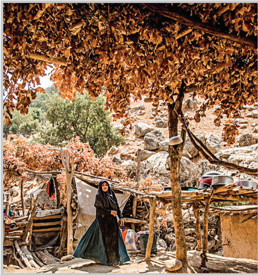
کارشناسان اقتصادی بر این باورند که یکی از الزامات مهم رفع فقر به صورت پایدار در کشور، توجه به تقویت نظام تامین اجتماعی و اجرای قوانین در این حوزه است.