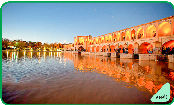
بازگشت آب به زاینده رود - اصفهان

به ۵ هزار سال قبل می رسد و گفته می شود اولین فلز کشف شده همین فلز مس بوده و اولین بار این ایرانیان بودند که صنعت فلزکاری را آغاز کردند. هنر مسگری از دیرباز در اصفهان، زنجان و کرمان به صورت تجاری دنبال شده است. مسگری در تهران قدیم نیز وجود داشته و حتی محصولات دست ساز این شهر به نقاط دیگر کشور فرستاده می شد. شغل «مسگری» در ایران، اما رو به فراموشی است و علت اصلی آن تغییر سبک زندگی مردم است. با وجود سابقه زیاد این شغل هنرمندان این رشته نسبت به قبل کمتر به تولید می پردازند و دیگر صدای چکش مسگری در گوشه کنار بازار به گوش نمی رسد. روزگاری در گرداگرد بازارهای بسیاری از شهرهای ایران، صدای «دنگ دنگ» چکش مسگران بر تکه های مس زیر طاق هلالی حجره ها گوش فلک را کر می کرد. حالا اما تنها یک نام از این هنر و از این بازار به جای مانده است. گذشت زمان و استفاده از ظروف تفلون، چدن و دیگر ظروف صنعتی تا حدودی باعث افول مسگری شده است. از طرفی بسیاری از هنرمندان مسگری که در دهه های گذشته در جای جای ایران فعال بودند دیگر در قید حیات نیستند و بازماندگان این هنر نیز بیشتر به سفیدگری و تعمیر ظروف و ابزار آلات مسی می پردازند تا ساخت آن.