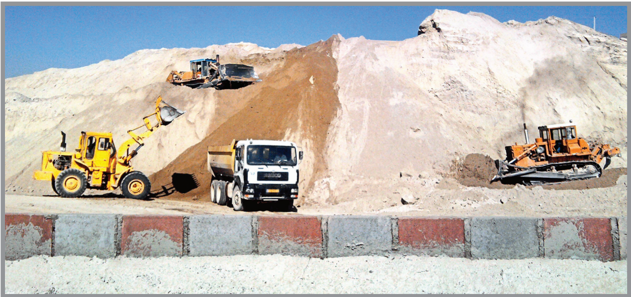
بخش مهمی از قراردادهای حوزه کار پروژه‌های پیمانکاری هستند که توسط شرکت‌های مختلف انجام می‌شوند. چگونگی و شرایط محاسبه و پرداخت حق بیمه این قراردادها از پرسش‌های همیشگی کارفرمایان است