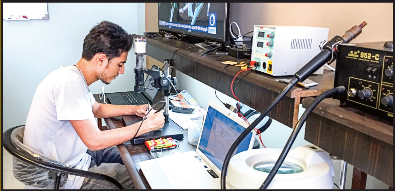
درصد مزد تعمیر کارانی که معمولاً در فروشگاه‌ها مشغول به کارند، ۶۰ تا ۴۰ درصد است؛ ۶۰درصد به تعمیر کار و ۴۰درصد به فروشگاه‌دار می‌رسد

مجموعه‌های سخت‌افزاری و نرم‌افزاری موجود، نگهداری، عیب‌یابی و تعمیر و اصلاح و توسعه فعالیت می‌کند. اما تعمیر کار این دستگاه‌ها برای مهارت‌آموزی باید مراحلی را پشت سر بگذارد. به‌طور کلی برای شرکت در کلاس‌ها و آموزشگاه‌های تعمیر کامپیوتر به تحصیلات بالانیزی نیست و افراد علاقه‌مند به این حوزه می‌توانند با حضور