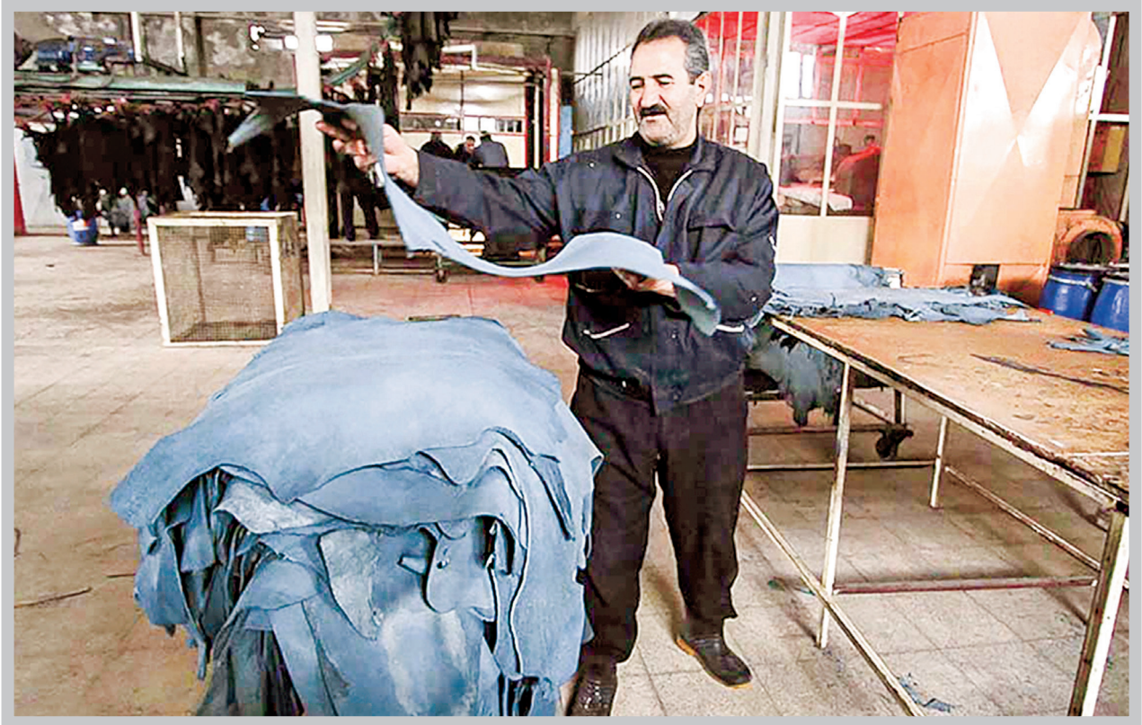
بنگاه‌ها حتما باید طرحی برای آینده فعالیت خود داشته باشند و با طرح توجیهی مناسب، منتخب دریافت تسهیلات شوند

پیشنهادی که اتاق اصناف ایران به وزارت صنعت، معدن و تجارت داده، پرداخت ۱۰ هزار میلیارد تومان به اصناف تولیدکننده کشور است. پنج صنعتی که در اولویت پرداخت هستند بدین قرارند: صنایع پوشاک، کیف، کفش، چرم، و چوب. فعلا به ۱۰۰ هزار بنگاه از ۶۵۰ هزار بنگاه اصناف مختلف کشور تسهیلات داده می‌شود و این طرح در آینده شامل سایر صنایع نیز خواهد شد. برنامه‌ریزی شده که این تسهیلات با سود ۱۶ درصد و بازپرداختی به طول چهار سال پرداخت شود. پرداخت تسهیلات به صنایع با هدف بازسازی و نوسازی خطوط تولید و کارگاه‌ها انجام می‌شود. گرچه ممکن است بخشی از این تسهیلات به تامین مواد اولیه بنگاه‌ها نیز اختصاص یابد.