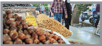
بازار در انتظار تغییرات احتمالی