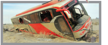
ارابه‌های مرگ در جاده‌ها می‌تازند