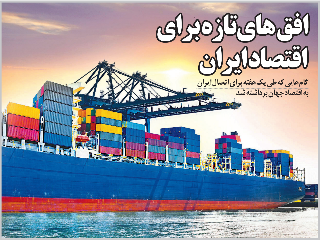
تولید ناخالص داخلی ایران در این سال نسبت به سال ۲۰۱۳ بالغ بر ۵۷ میلیارد دلار افزایش داشته است. همین اعداد و ارقام باعث شده تا برخی رسانه‌ها هم از ایران به‌عنوان بازری که نمی‌شود بر جزاییت‌های آن چشم‌پست، یاد کنند

گام‌هایی که طی یک هفته برای اتصال ایران به اقتصاد جهان برداشته شد