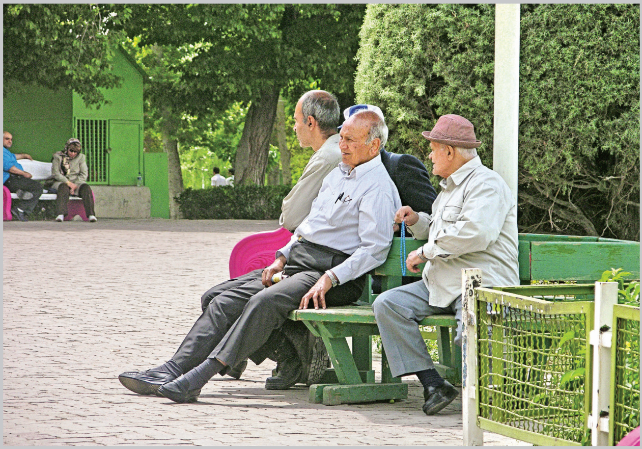
ایزاب نگرانی سخنگوی دولت درباره صندوق های بازنشستگی این سوال را پیش آورده که چرا مقامی که مامور بررسی دخل و خرج کشور در مقام ریاست سازمان و برنامه ریزی کشور است، اعلام خطر می کند. پاسخ روشن است...

راهکارهای برنامه ششم توسعه برای حمایت از صندوق های بازنشستگی کدام اند؟