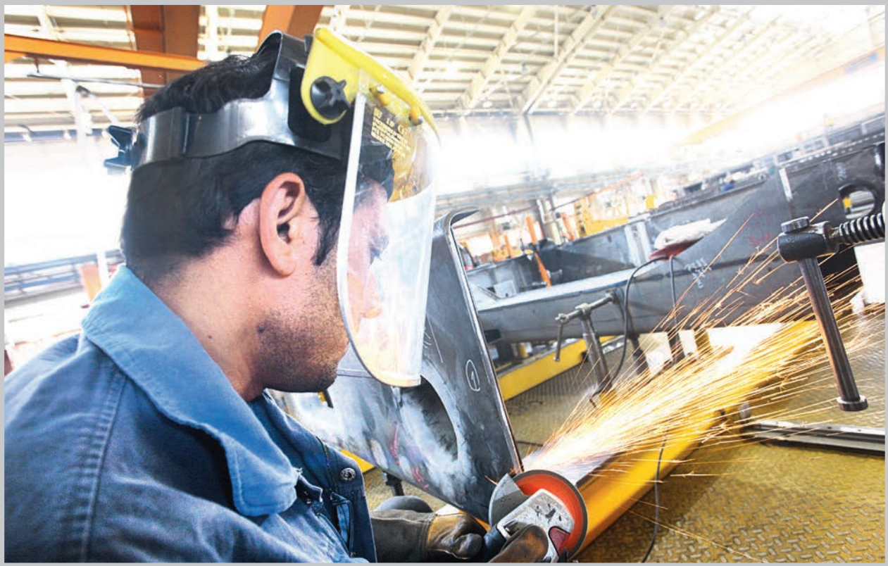
رسیدن بیکاری جوانان به مرز ۲۷ درصد مسئله‌ای نیست که بتوان به‌سادگی از کنار آن گذشت. سال گذشته وزیر کار، خبر داده بود که طی ۵ سال آینده حدود ۵ میلیون جوان به بازار کار سرازیر می‌شوند و باید برای حدود ۸ میلیون ایرانی جویای کار شغل ایجاد شود

با وجود کاهش درآمدهای نفتی دولت یازدهم تلاش دارد نرخ بیکاری را تک‌رقمی کند