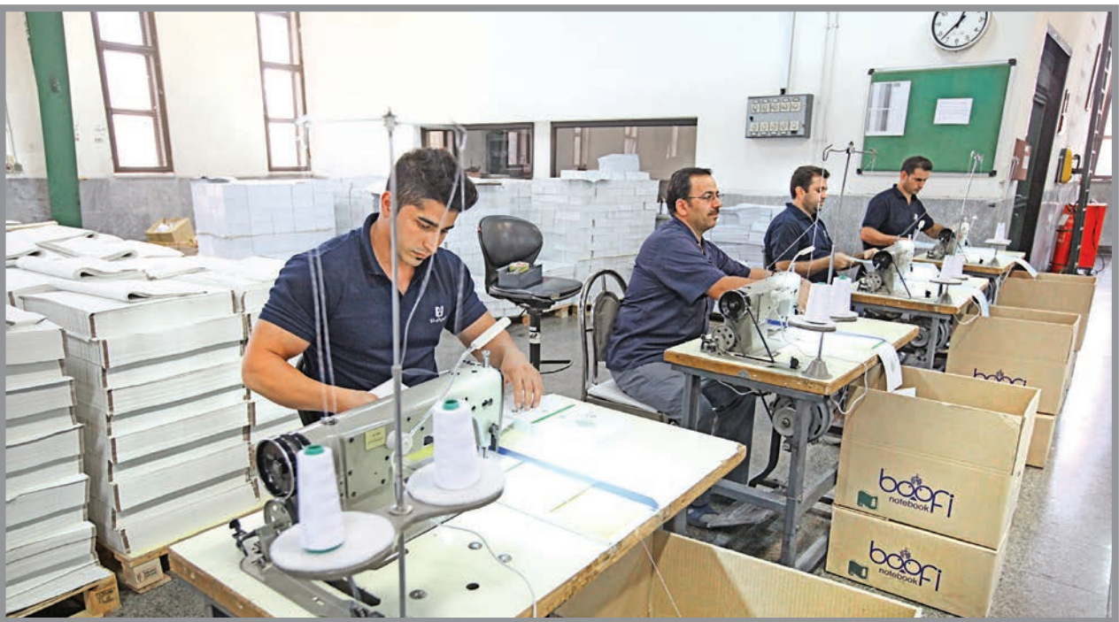
کارفرما مکلف است ترک کار کارکنان خود را در لیست همان ماهی که بیمه شده ترک کار کرده است درج و لیست را در مهلت مقرر به سازمان تسلیم کند

یکی از دغدغه‌ها و مشکلات سازمان‌های بیمه‌ای نداشتن آگاهی و اطلاعات ناکافی کسانی است که از خدمات این سازمان‌ها استفاده می‌کنند. موضوعی که نه فقط گاهی موجب تخصیص حقوق بیمه‌شدگان، کارگران و کارفرمایان می‌شود بلکه باعث تحمیل هزینه‌های اضافی و هدر رفت وقت مفید نیروی انسانی می‌شود. استفاده از مشاوره کارشناسان بهترین راه برای رفع این مشکل و صرفه‌جویی در هزینه و وقت است. «پرسش» جایی است که شما می‌توانید سوالات مرتبط با بیمه، حقوق و مقررات کار را با مشاور مادر میان بگذارید و پاسخ آن را در همین صفحه بخوانید. برای این منظور می‌توانید سوالات خود را از طریق ایمیل persesh.11@gmail.com برای ما ارسال کنید.