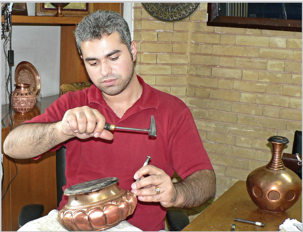
کارهای من ظریف کاری است و سروصدای زیادی ندارد که خانواده‌ام را آزار دهد، ولی به هر حال هر کاری سختی‌ها و مشقت‌هایی دارد. کار در کارگاه شخصی آدم را آرام می‌کند