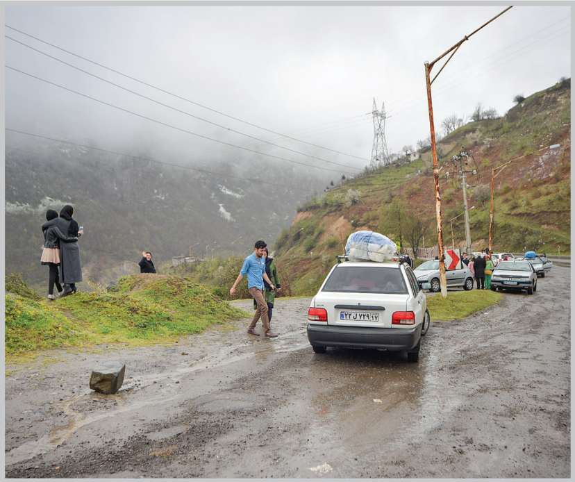
با نزدیک شدن به روزهای عید نوروز، آنچه اهمیت دارد حمایت قانونمند و برنامه ریزی شده از مردم در قالب بسته های حمایتی سفر است.