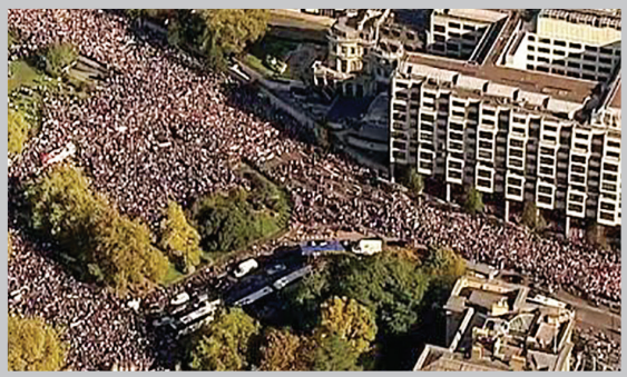
هفتصد هزار نفر در لندن راهپیمایی کردند و خواستار دومین رفاندوم در مورد بریتانیا شدند.