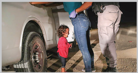
قانون‌جسازای کودکان مهاجر از خانواده‌شان به تازگی در آمریکا ابراشده بود، که این عکس گرفته شد.