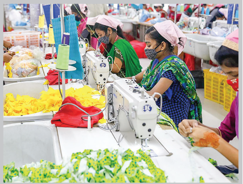
کارگران زن بنگلادشی در یک کارخانه اروپایی، در غازیپور کار می‌کنند در حالیکه از حقوق اولیه خود برخوردار نیستند.