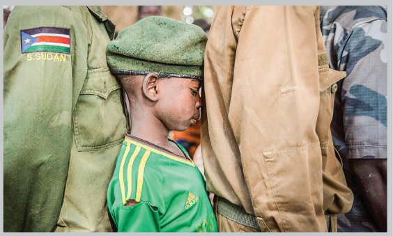
سرپاز کودکی که در سودان جنوبی اسیر شده است. گفته می‌شود که تعداد زیادی از آنها در خط‌اول جنگ عربستان در یمن قرار می‌گیرند.