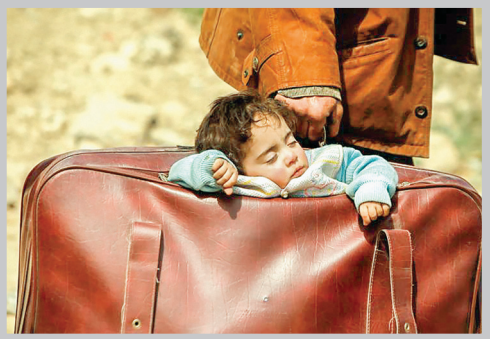
عکس را خبرگزاری رویترز با عنوان «کودکی خوابیده در چمن» منتشر کرده که او را گی در سوریه به راه تصویر می‌کشد.