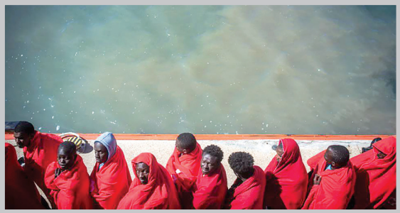
مهاجران آفریقایی که از تنگه جبل الطارسی نجات یافته‌ند به بندر باربات اسپانیا می‌رسند.