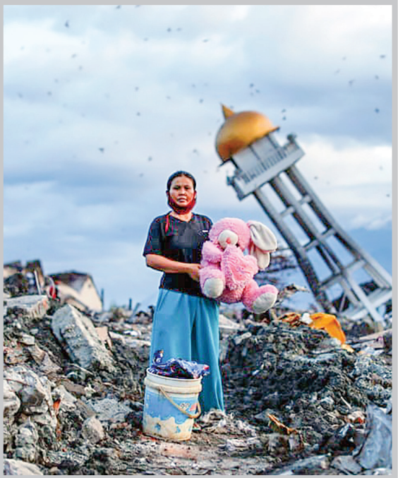
زنی که با یک عروسک بر ویرانه‌های زلزله و سونامی اندونزی ایستاده است. این عکس در مجموعه منتخب ۲۰۱۸ قرار دین است.