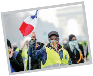
یکشنبه ۱۶ دی ۱۳۹۷ • شماره صد و هشتاد و پنج