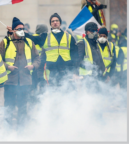
درنگاه اول، اعتراضات اخیر فرانسه مربوط به تغییر نرخ سوخت خودروها بود و اغلب ساکنان

کارشناسان اقتصادی، همچون معترضان بر این باورند که تجزیه و تحلیل بودجه سال آینده فرانسه این واقعیت را نمایان خواهد کرد که خانواده‌های فرانسوی سال آینده فقیرتر از امسال خواهند شد، چون نرخ مالیات‌ها افزایش یافته و به این ترتیب درآمد کمتری به کارگران و شاغلان خواهد رسید. برخی نظریه‌ها بیان می‌کند این بودجه برای ثروتمندتر شدن پولدارها و فقیرتر شدن کارگران تنظیم شده که در راس آن، نگرانی بسیار زیادی برای یک‌درصد بازنشسته‌های فرانسوی ایجاد کرده است. چون این گروه منابع درآمدی محدودی دارند.