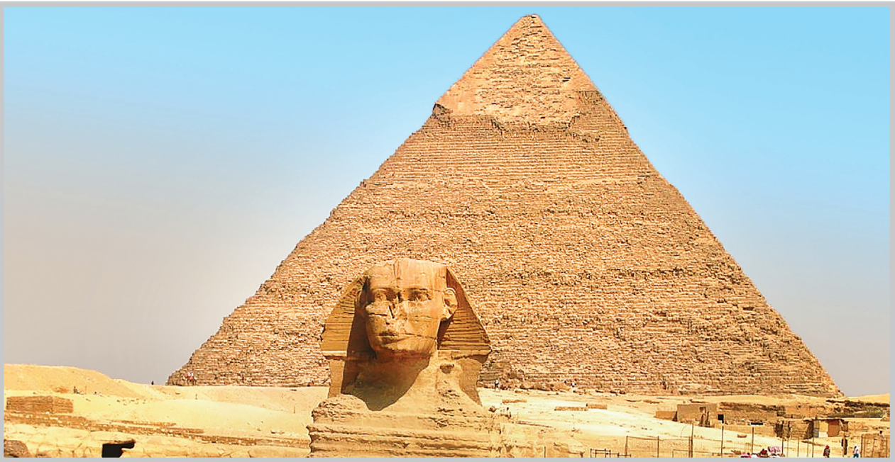
انتشارات «ققنوس» مجموعه‌ای دارد به نام «مجموعه تاریخ جهان» که از تصور عموم در مورد کتب تاریخی به‌دور است.

نزدیک، همین‌جا یا جایی دیگر، شرایطی مشابه شرایط فعلی وجود داشته و در آن نوره، پیمودن چه راهی، گرفتن چه تصمیمی، منجر به چه اتفاقی شده است و اینجاست که اگر ملتی تاریخ نخوانده باشد و از تجربه گذشته بشر استفاده نکرده باشد، ناچار است که خود تجربه کند و البته تجربه معمولاً گران تمام می‌شود و این یعنی تکرار تاریخ. همه این‌ها را گفتیم که به اینجا برسیم که انتشارات «ققنوس» مجموعه‌ای دارد به نام «مجموعه تاریخ جهان» که از تصور عموم در مورد کتب تاریخی به‌دور است. هر جلد از این مجموعه که از روی مجموعه‌ای به همین نام از انتشارات «Lucent Books» ترجمه و منتشر می‌شود، به تاریخ نقطه‌ای از جهان در مقطعی خاص می‌پردازد و آن‌قدر متنوع و گسترده است که از تاریخ انسان‌های اولیه تا عصر معاصر را شامل می‌شود که ال‌زاماً تاریخ سیاسی نیست و البته هیچ‌کدام