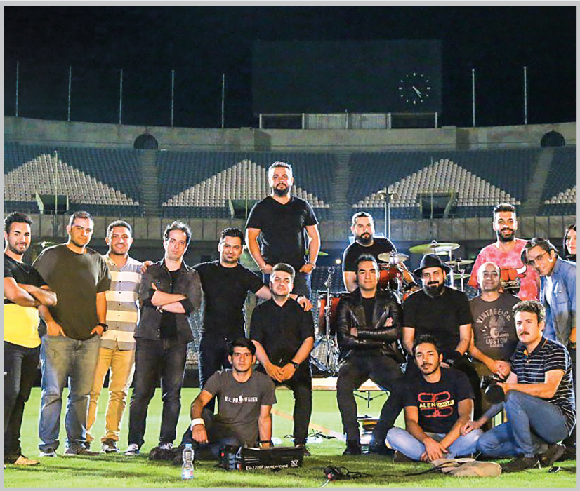
نمایی از فیلم آبی به رنگ آسمان

راهنمایی جمع و جور برای سینمادوستانی که می‌خواهند مهمان دوازدهمین جشنواره فیلم «سینما حقیقت» شوند