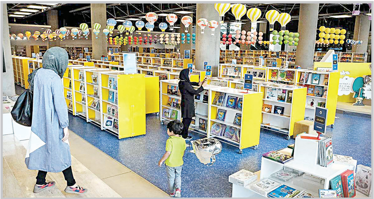
روز کتاب همین پنجشنبه ای بود که گذشت، اما هفته کتاب تا اول آذر ادامه دارد. بنابراین پیشنهاد دیگر ما این است که در این هفته سری به کتاب فروشی ها بزنید.

نوجوانان، ضمن معرفی زبان ها و گویش های مختلف کشور، کتاب و کتاب خوانی را ترویج می کند. این هم از هنرش!