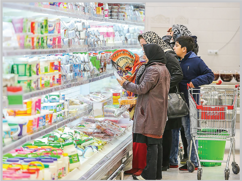
واردات کالاهای اساسی نیز به طور چشمگیری افزایش پیدا کرده است، همچنین ارز ارزان فرادار اختیار وا‌ردکنندگان کالای اساسی قرار گرفته‌است.