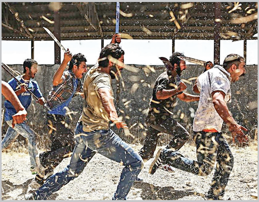
«مغزهای کوچک زنگ‌زده» آینه‌اش را در حاشیه این کلانشهر قرار می‌دهد، جایی که لبریز از خشم و خشونت است و خلافکارها جا را برای دیگران تنگ کرده‌اند.

«جاده قدیم» چهارمین فیلم سینمایی منیژه حکمت در مقام کارگردان پس از ۱۰ سال دوری است. او در سال‌های اخیر بیشتر به‌عنوان تهیه‌کننده و پخش‌کننده فعالیت داشت. «جاده قدیم» قصه زنی آسیب‌دیده است و اتفاقاتی که بر او می‌گذرد و با تمام آسیب‌های اجتماعی و جسمی که دیده در جایی که به‌بن‌بست رسیده، بلند می‌شود و از نو شروع می‌کند. به‌لحاظ مضمونی می‌توان فیلم را نزدیک به «فروشنده» اصغر فرهادی دانست. چون اینجا هم کارگردان درباره ماجرای خطرقرمزی تجاوز و تبعاتش سخن می‌گوید. مهتاب کرمانی، آنیلا پسیانی، پرویز پورحسینی، ترلان پروانه، محمدرضا غفاری، شیرین یزدان‌بخش، لیلی رشیدی، محمدرضا هدایتی و بهناز جعفری در این فیلم بازی کرده‌اند.