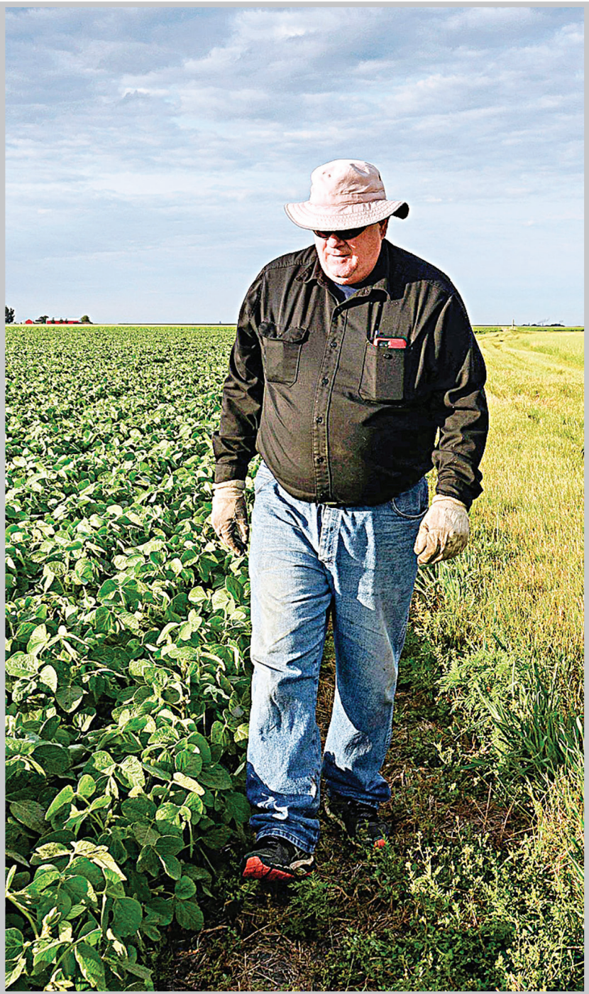
جمهوری خواهان ترجیح می‌دهند باتوجه به افزایش طول عمر، به تدریج سن بازنشستگی را به ۶۸، ۶۹ یا ۷۰ سالگی برسانند.