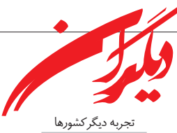
تجربه دیگر کشورها

حقوق کارگران چیست؟ آیا این حقوق که حتی در بسیاری موارد به طور کامل اجرانمی‌شود برای این قشر از جوامع کافی است؟ دست کارگران برای احقاق حقوق دست نیافته‌شان به کجا بند است؟ شاید بهتر باشد برای دریافت پاسخ این پرسش‌ها سری بزنید به کتاب «توافق نامه‌های جمعی، حفاظت از کارگران» که اخیراً از سوی سازمان جهانی کار منتشر شده. این کتاب به بحثی جامع در راستای گسترش توافقات جمعی و استفاده از آن به‌عنوان یک ابزار سیاستی برای گسترش پوشش محافظت از کارگران پرداخته است. شما می‌توانید نسخه پی‌دی‌اف این کتاب را از سایت سازمان جهانی کار و به‌صورت رایگان دریافت کنید.