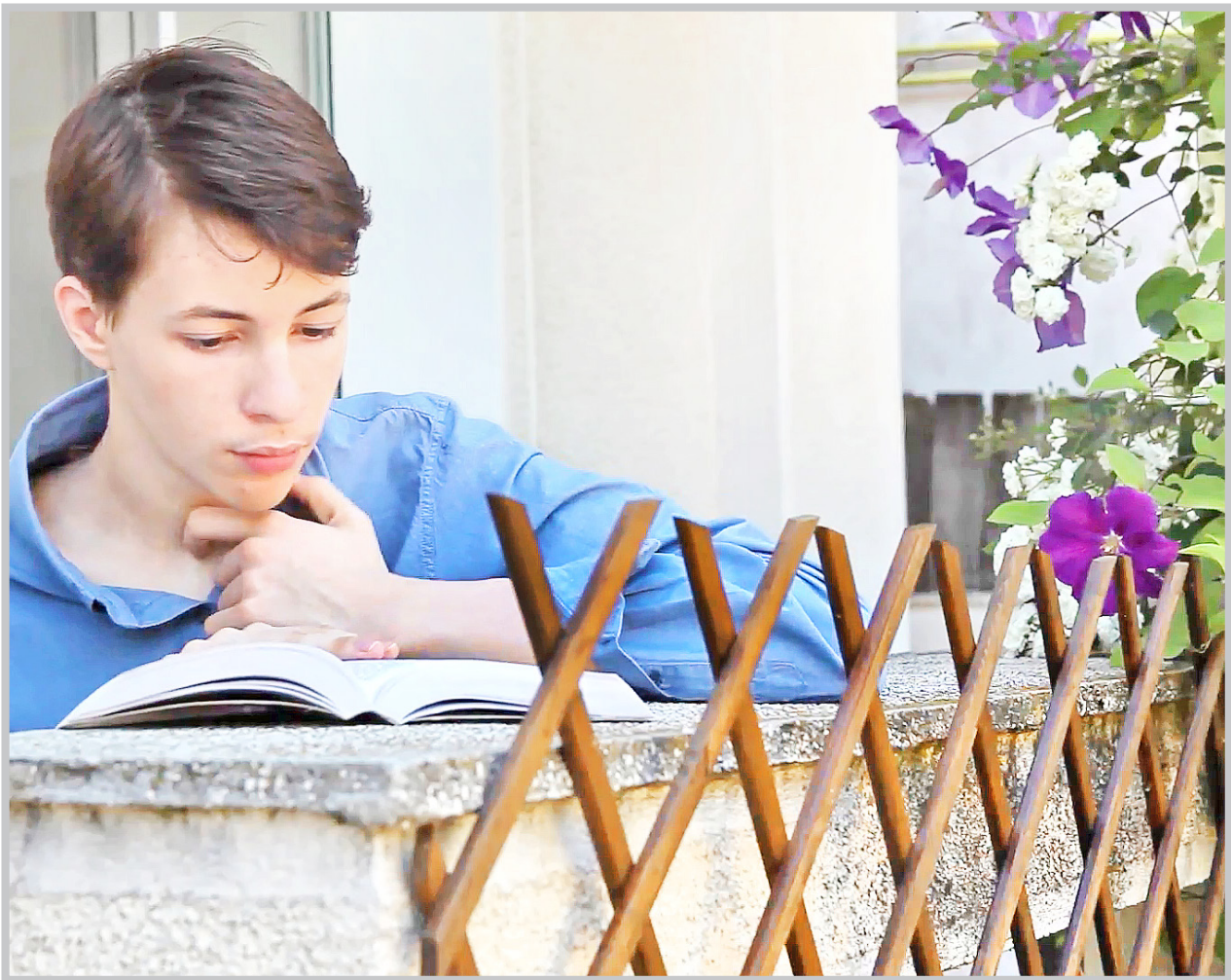
از ویژگی‌های قابل توجه سه گانه شاه‌آبادی، ایرانی بودن داستان است. داستان در فرهنگ ایرانی اتفاق می‌افتد و برای مخاطب باورپذیر است.

کرده‌اند، شاید حقوق کودکان در ایران جدی‌تر گرفته می‌شد.