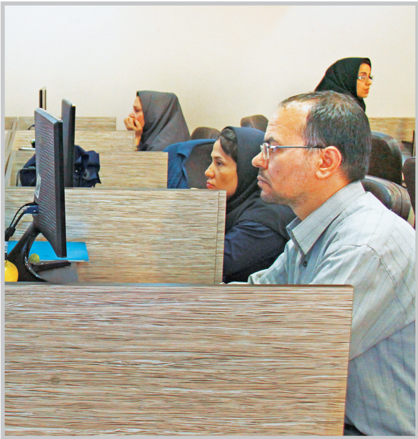
بیمه‌شدگان حوزه رسانه و مطبوعات با توجه به اینکه فاقد رابطه مزدگیری با مرجع معرفی کننده هستند، مشمول بیمه بیکاری نمی‌شوند.

مشمول این نوع بیمه قرار گیرند، با چه شرایطی؟ بله، متقاضیان که مشمول بیمه صاحبان حرف و مشاغل آزاد یا اختیاری هستند، در صورت عدم قطع بیمه‌پردازی می‌توانند پس از پایان دوره پیش‌پرداخت حق بیمه خود بدون در نظر گرفتن شرایط سن و سابقه ذکر شده در سوال ۲، با ارائه معرفی نامه از مرجع معرفی کننده با رعایت سایر شرایط مقرر از جمله انجام معاینات پزشکی (در صورت لزوم) در زمره مشمولان این نوع بیمه قرار گیرند. ضمناً این گروه از بیمه‌شدگان در صورت تمایل می‌توانند در هر مرحله نسبت به قطع بیمه‌پردازی بیمه توافقی مذکور (بیمه فعالان حوزه رسانه و مطبوعات) و ادامه پرداخت حق بیمه به صورت بیمه اختیاری یا مشاغل آزاد اقدام کنند.