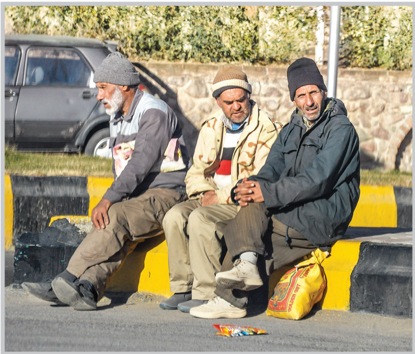
سوابقی که ۳ درصد حق بیمه به‌عنوان حق بیمه بیکاری از سوی کارفرما پرداخت شده در میزان مدت پرداخت بیمه بیکاری موثر است.

■ برای زنانی که در مرخصی زایمان و شیردهی به سر می‌برند و پس از اتمام مرخصی مذکور، کارفرما آنان را اخراج کرده یا با عدم تمدید قرارداد از سوی کارفرما بیکار می‌شوند، مقرری بیکاری پرداخت می‌شود؟