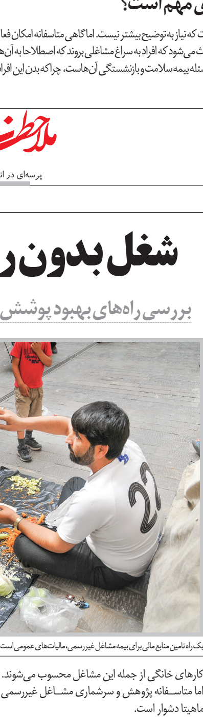
یک راه‌تأمین منابع مالی برای بیمه مشاغل غیررسمی، مالیات‌های عمومی است.

بنا بر آمار سازمان ملل، در سال جاری بیش از ۶۱درصد جمعیت شاغل در جهان، از طریق مشاغل غیررسمی معیشت خود را تأمین می‌کنند. براساس این یافته‌ها بین میزان تحصیلات و محل سکونت با میزان درگیری افراد در مشاغل غیررسمی رابطه وجود دارد. به‌طوری که افراد با تحصیلات پایین‌تر و ساکن در روستاها نسبت به افراد با تحصیلات بالاتر که در شهرها زندگی می‌کنند بیشتر در مشاغل غیررسمی فعالیت می‌کنند. نکته‌ای که نشان می‌دهد سیاست‌های اجتماعی، اقتصادی و توسعه‌ای تا چه میزان بر تولید و تشدید زیست غیررسمی گروه‌های محروم در جامعه اثرگذار است. به‌گفته برخی مسئولان، در ایران نیمی از شاغلان در مشاغل غیررسمی فعالیت می‌کنند. این مشاغل گستره زیادی از فعالیت‌ها را در بر دارد و شاید نقطه مشترک اصلی میان آن‌ها از منظر سیاست‌گذاران، عدم نظارت و کنترل دولت بر آن‌هاست. واژه‌هایی همچون مشاغل زیرزمینی، سیاه و پنهان نیز به این فعالیت‌ها الحاق می‌شود. پرواضح است که امروزه معیشت بسیاری از تهی‌دستان جامعه از طریق فعالیت آنان در مشاغل غیررسمی تأمین می‌شود. مشاغل غیررسمی در اقتصادی که عمیقاً رفتار بحران‌های گوناگون است و بخش رسمی اش سال‌هاست از تأمین