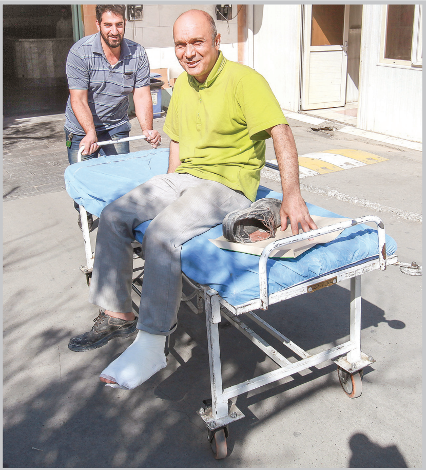
چنانچه وقوع حادثه با وظیفه شغلی بیمه‌شده بی‌ارتباط باشد یا ناشی از الزامات و مقتضیات کار وی در حد متعارف نباشد حادثه ناشی از کار تلقی نمی‌شود.

... که برای تحقق همسان‌سازی گرفته‌ایم را به‌خوبی هزینه نکرده‌ایم؟ آیا روش پلکانی (در افزایش مستمری‌ها) روش ابداعی من نبود؟ آیا فاصله مستمری‌های ۴۰۰ تا ۵۰۰ هزار تومان با امروز که حداقل یک‌میلیون و ۳۰۰ هزار تومان است حاصل تلاش این دوران نبود.» وزیر کار به موضوع بیکاری نیز پرداخت و گفت: «بیکاری بالا، محصول سیاست‌های اشتغالی و وضعیت بازار کار است و هیچ ارتباطی به وزارت کار ندارد، اما من خودم را وزیر بیکاران نامیدم تا به مردم خدمت کنم.» به گفته ربیعی، اگر آبشاریکه‌ای در اشتغال وجود دارد ناشی از سیاست‌ها، تلاش‌ها، برنامه‌ها و عملکرد وزارت کار است. وی با تاکید بر اینکه در هیچ دوره‌ای مانند امروز کارگر و کارفرما به هم نزدیک نبودند، شفافیت و کنار گذاشتن اختلافات را رمز حل مشکلات و معضلات دانست و افزود: «ما پول پخش نکردیم و معتمد عمלקردمان در مسائل مربوط به فقر و توانمندسازی صحیح بوده است.» ربیعی به خروج تأمین اجتماعی از بنگاهداری هم اشاره و اعلام کرد: «مقدمات فروش ۵۰ بنگاه بزرگ در مجموعه تأمین اجتماعی فراهم شده است.» با اتمام صحبت‌های ربیعی، رای‌گیری انجام شد که از مجموع ۲۴۳ رای مأخوذه، در مقابل ۱۱۱ نفری که مخالف استیضاح بودند، ۱۲۹ نماینده با رفتن ربیعی موافقت کردند و سلف‌نفر رای متعند دادند و بدین ترتیب علی ربیعی از مسئولیت خود در وزارت تعاون، کار و رفاه اجتماعی کنارت رفت.