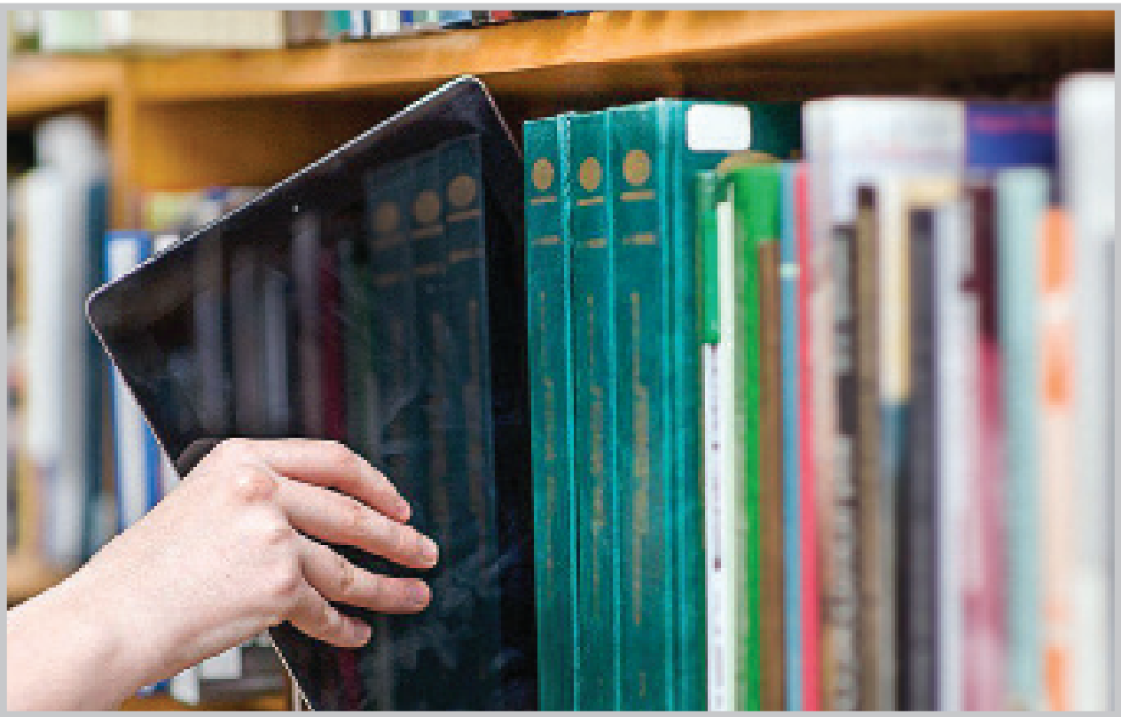
«طاقچه» یکی دیگر از برنامه‌های کتابخوان فارسی است که هزاران کتاب و نشریه و کتاب صوتی را به کاربرانش عرضه می‌کند و دارای بخشی است که به ارائه کتاب‌های الکترونیکی رایگان اختصاص دارد.

هرچه بیشتر ما با ادبیات فارسی شده است. یکی از امکانات قابل توجه برنامه‌ک «کتابراه» و دو کتابخوان دیگری که در ادامه معرفی می‌کنیم، ارائه چندین آثار کلاسیک ادبیات فارسی است تا کاربران بتوانند به سهولت به این آثار دسترسی داشته باشند. «کتابراه» از شعر معاصر هم غافل نبوده و آثاری چون برگزیده اشعار احمدشاملو، «منظومه‌ارش کمانگیر» سیاوش کسرایی، گزیده اشعار ملک‌الشعرا ی‌بهار، دفتر شعر «تولد دیگر» فروغ فرخزاد و... را به مخاطبان عرضه داشته است. افزون بر این، برخی آثار پژوهشگران بزرگ ایرانی مانند «مثنوی معنوی: شریعت و طریقت» اثر مرحوم دکتر عبدالحسین زرین‌کوب نیز به غنای این مجموعه افزوده است. آثار نویسندگان معاصر ایرانی هم در میان این کتاب‌های رایگان به چشم می‌خورد. آثار جلال آل احمد مانند «نون و قلم»، «سه‌تار»، «سنگی بر گوری»، «غرب‌زدگی» و... از شناخته‌شده‌ترین این آثار است. کتاب‌های متعدد آموزشی مانند «توصیه‌های سفر» به قلم مسعود فیروزکوهی، «آموزش الفبای کاربردی کامپیوتر» نوشته محمدرضا سواری، «آموزش جامع عکاسی به زبان ساده» اثر سیدمیشم موسوی، «آموزش مهارت‌های هفت‌گانه (ICDL)»، «شبکه‌های رایانه‌ای» نوشته آرشین خوش‌رو و... فرصت خوبی را در اختیار علاقه‌مندان برای یادگیری مطالب تازه قرار می‌دهد. کتاب‌های رایگان صوتی کوتاه، مانند «حسن کچل»، «جهنم، بهشت» جومپا لاهیری، «قبل بر وزن دهل»