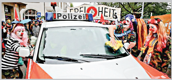
تظاهرکننده‌ها با لباس دلقک پنجره‌های یک ماشین پلیس سوئیس را پاک می‌کنند.