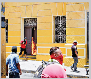
تظاهرات روز جهانی کارگر در هندوراس، به درگیری ختم شد.