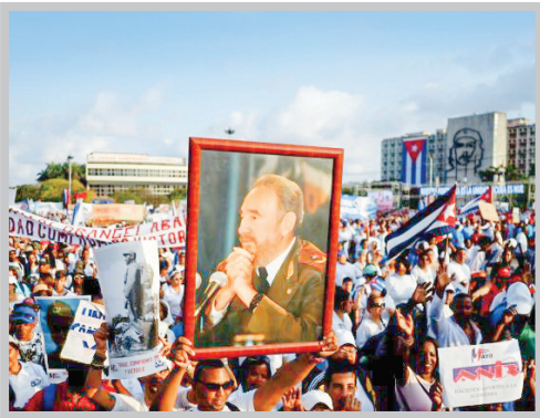
مردم طی تظاهرات روز اول ماه می در هاوانای کوبا، عکس‌های فیدل کاسترو، رئیس‌جمهور سابق کوبا را به نمایش می‌گذارند.