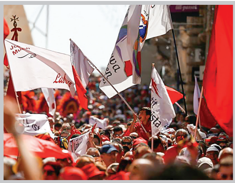
حامیان حزب کارگر در مالت، روز اول ماه می را جشن می‌گیرند.