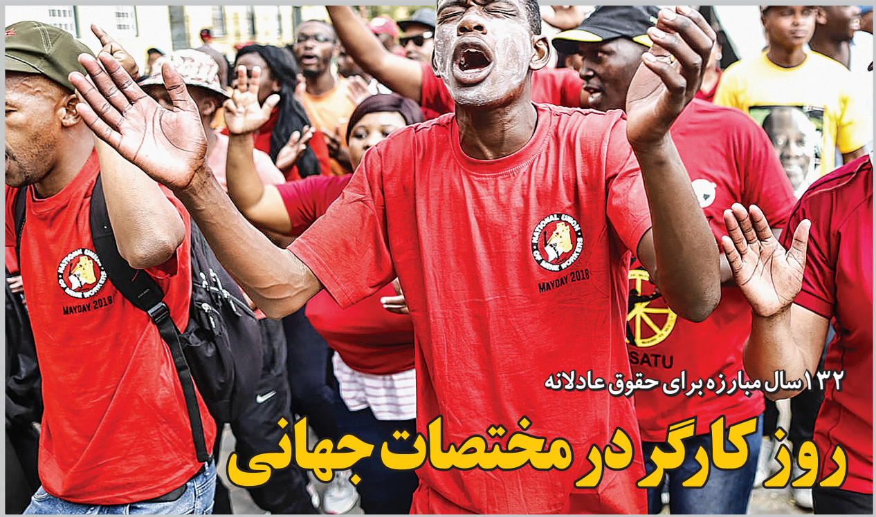
اعضای انگره اتحادیه‌های کارگری آفریقای جنوبی (COSATU) در تظاهرات ماه می در کیپ‌تاون، آفریقای جنوبی

«می‌دی» روزی است که از آمریکایی‌ها قرض گرفته شده. اما می‌توان گفت هیچ چیز به اندازه اعتراض و تظاهرات، فرانسوی نیست و البته گل که با فرهنگ فرانسه آمیخته است. روز کارگر در فرانسه هم رنگ‌وبوی سیاسی و اجتماعی دارد و هم بوی گل. طبق سنتی قدیمی در اولین روز ماه می، دادن گل به دوستان و آشنایان خوش‌شانسی می‌آورد. اول می تنها روزی است که دولت در فرانسه به هر کسی اجازه می‌دهد بدون مجوز و معاف از مالیات در خیابان گل بفروشد. همچنین از سال ۱۸۹۰ سنت دیگری در «می‌دی» باب شد و آن قراردادان یک مثلث قرمز بر یقه پیراهن است. اضلاع این مثلث نشان‌دهنده تقسیم یک روز ایده‌آل به سه قسمت مساوی؛ کار، تفریح و خواب است. برخی نیز این مثلث را با یک دسته گل کوچک که دور آن روبان قرمز پیچیده شده جایگزین کرده‌اند. روز کارگر در فرانسه به معنی تعطیلی همه بخش‌ها از سوپر و حمل‌ونقل گرفته تا موزه‌هاست. حتی موزه مشهور لوور نیز در این روز تعطیل است و حمل‌ونقل عمومی در شهرهای کوچک متوقف و در شهرهای بزرگ با فاصله‌های زمانی بسیار طولانی انجام می‌شود. اغلب رستوران‌ها نیز تعطیل است.