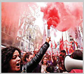
کارگران آرژانتینی، در اولین روز می به خیابان آمدند.