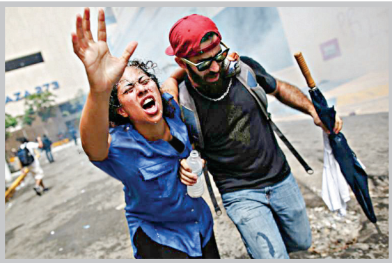
کارگران پورتوریکو در اعتراض به اقدامات ریاضتی در سن خوان (کشور یوتا).