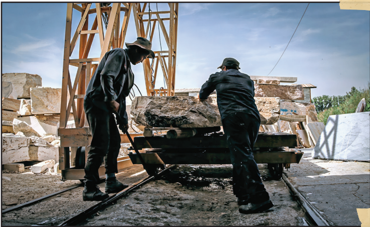
• کارگرانی که همدلی و همکاری در جابه‌جایی این سنگ‌های سخت در بین‌شان موج می‌زند.

در دل یکی از مناطق صنعتی حاشیه شهر تهران، جایی میان هیاهوی ماشین‌آلات سنگین و غبار هوای آلوده، لابه‌لای کارخانه‌ها و کارگاه‌های ریز و درشت، کارگاهی نه‌چندان بزرگ اما پر از صدا و حرکت، غرق در براده‌های سنگ معلق در هوا نفس می‌کشد. میان این سختی‌ها، چیزهایی هست که شاید تنها دوربین بتواند به چشم بیاورد. این عکس‌ها تلاش می‌کنند تا لحظه‌هایی از این دنیای فراموش شده در دل حاشیه تهران را روایت کنند.