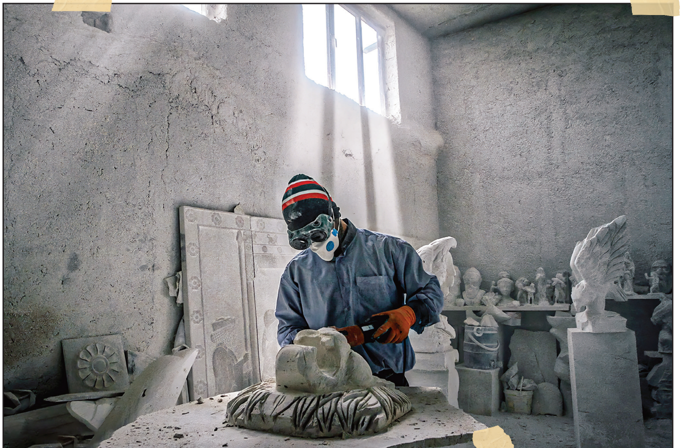
• کارگاه سنگ‌بری؛ جایی که پرتوهای آفتاب از لحظه طلوع تا غروب بر تکه‌سنگ‌های بریده شده می‌تابند.

• اینجا، هر خراش روی دست، هر قطره عرق و هر آه کشیده شده از سر خستگی، بخشی است از حقیقتی که پشت نمای سنگ‌هایی که هر روز در شهر نمایان می‌شود، پنهان مانده است.