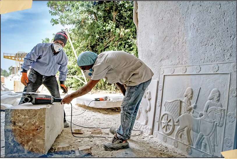
• مردانی سختکوش با دستان پینه‌بسته، عرق‌ریزان، بی‌وقفه در مسیر شکل دادن به این سنگ‌های سخت مشغولند.

• صدای اره‌ها با صدای نفس‌های کارگرانی درهم می‌آمیزد که روزمرگی زیستن‌شان با دنیای سنگ و چکش، اره و دستگاه فرز در هم آمیخته است.