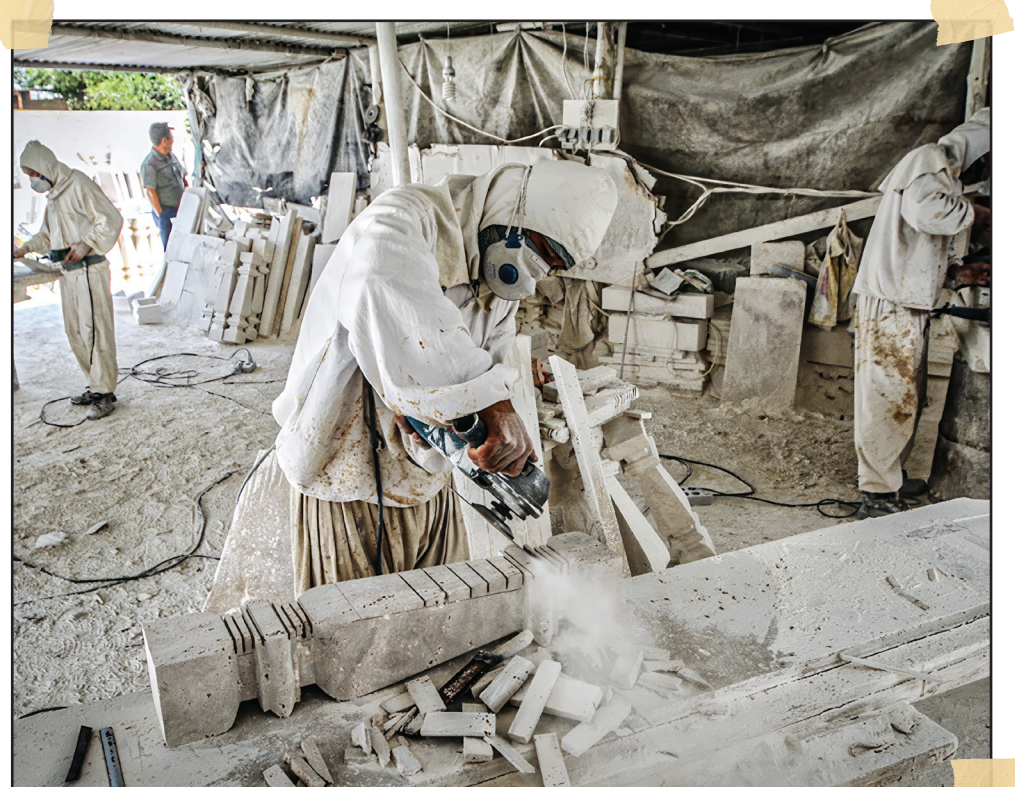
• در این کارگاه سنگ‌های زمخت و بدقواره به دست کارگران ماهر تبدیل به سنگ‌هایی زیبا و هم‌اندازه و صیقلی می‌شوند.