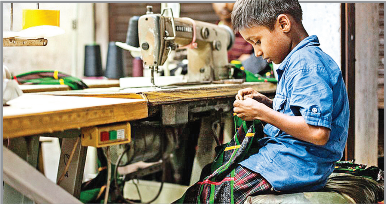
کودک کار به کودک زیر ۱۵ ساله‌ای گفته می‌شود که از سر ناچاری و یا به اجبار به خدمات گرفته می‌شود و بسیاری از آن‌ها را از تحصیل و تجربه کودکی بازمی‌دارد

به گفته یونیسف ۲۵ میلیون کودک خیابانی در آسیا وجود دارد. در داکای بنگلادش ۱۰ هزار دختر در خیابان‌ها زندگی می‌کنند. در فیلیپین «دیار تمان رفاه و رشد اجتماعی» تخمین زده است که ۱/۲ میلیون کودک خیابانی در این کشور وجود دارد. وزارت رفاه اجتماعی هند در دهه گذشته تخمین زده بود که ۱۱ میلیون کودکی که در خیابان‌ها زندگی می‌کنند ۷۵ تا ۲۰۰ هزار نفر آن‌ها در کلکته هستند. موسسات غیردولتی هند می‌گویند در حال حاضر این تعداد چند برابر شده و احتمالاً مرگ والدین به علت ایدز باعث شده آمار آن‌ها به سرعت افزایش یابد. همچنین تعداد کودکان خیابانی ویتنام را ۱۹۰ تا ۲۰۰ هزار نفر تخمین زده‌اند. یونیسف تخمین می‌زند که دست‌کم در ویتنام ۱۶ هزار کودک خیابانی، ۲۰ هزار کودک قربانی روسپی‌گری و ۴ هزار و ۳۰۰ کودک معتاد وجود دارد.