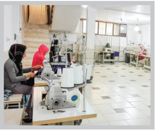
ناماینده مجلس شورای اسلامی

باتمام این اوصاف، کارگران را امیدنیستند. هرچند قراردادهای موقت اکثر قریب به اتفاق کارگران را در محیط‌های کاری آزار می‌دهد و متأسفانه حدود دو و نیم دهه است که برخی مجریان قانون کار تمایلی به اجرای ماده ۷ قانون کار ندارند، هرچند قدرت خرید کارگران در سال‌های اخیر به‌شدت آسیب دیده و سفره‌های خانوار کارگری کوچک شده، هرچند بسیاری از کارفرمایان از ایجاد محیط ایمن و بهداشتی برای نیروهای خود طفره می‌روند، هرچند بسیاری از کارگران مطالبات چندماهه موقوف دارند و... با این حال دولت یازدهم در چهار سال فعالیت خود نشان داده است که سعی خود را برای اصلاح این روند و روابط معیوب در محیط‌های کاری کرده است. پذیرش هزینه حداقلی خانوار از سوی کارفرمایان و دولت در جلسات سال ۹۵ شورای عالی کار، پیشی گرفتن حداقل دستمزد از نرخ تورم در چهار سال فعالیت دولت یازدهم به میزان ۴ درصد، کاهش حوادث ناشی از کار و کاهش شدید مرگ‌ومیر (حدودا ۱۸ درصد) در محیط‌های کاری، عزم معاونت روابط کار وزارتخانه برای ثبت تمامی قرارداده‌ا در سامانه وزارت تعاون، کار و رفاه اجتماعی، ایجاد اشتغال (خالص تعداد مشاغل در پایان سال ۱۳۹۵ حدود یک میلیون و ۳۰۰ هزار شغل بیشتر از پایان سال ۹۲ را نشان می‌دهد) و به‌تبع آن شایلیدن بذر امید در جامعه که سبب افزایش ۱/۸ درصدی جمعیت فعال کشور در سال ۱۳۹۵ نسبت به سال ۱۳۹۲ شده است و... گام‌هایی است کوچک اما امیدوارکننده که کارگران را به بهبود شرایط و حرکت به سوی جامعه‌ای عادلانه‌تر امیدوار می‌کند.