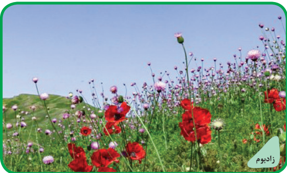
دشت شقایق بیلافت کرمون - گیلان